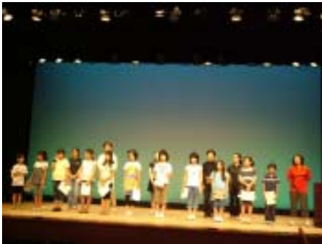
昨年度演劇教室発表会 終了式

・申込書を、柏崎市総合企画部文化振興課(本館3階)へ直接持参するか郵便又はファックスでお送りください。(〒945-8511 柏崎市中央町5-50 FAX:24-7714)