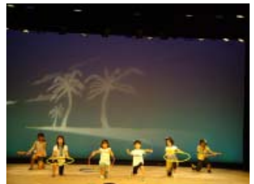
昨年度演劇教室発表会 B班「魔法の種」