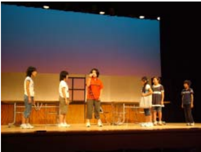
昨年度演劇教室発表会 A班「囁つきクラブ」